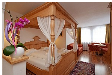
JUNIOR SUITE MOENA