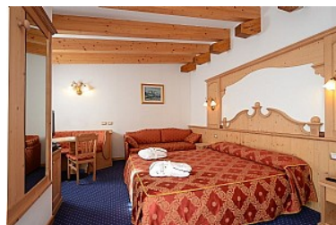
JUNIOR SUITE MARMOLADA